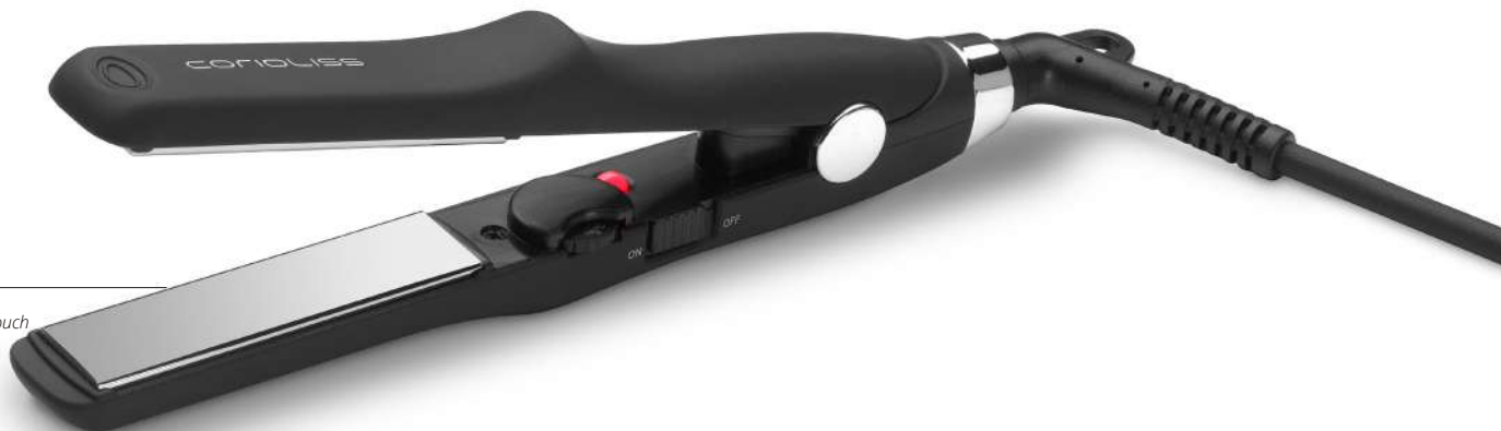
C-TRIP BLACK SUK1480 Soft Touch

En pocos minutos consigues tener ese alisado express de salón, con la máxima suavidad y brillo... ¡y cero encrepamiento durante horas!