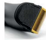
CLIPPER CRS-201 - BLACK METAL EDITION SUK1802