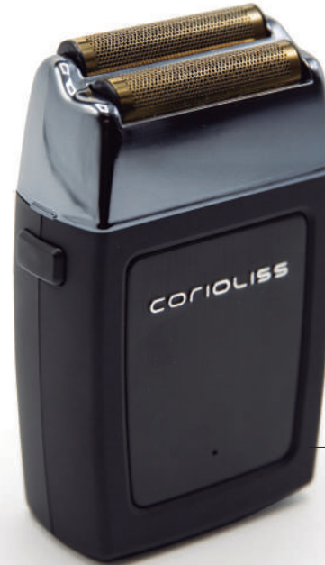
THE SHAVER SUK1820

Cuenta con un motor de altas prestaciones y batería de iones de litio sin efecto memoria con 90 minutos de funcionamiento ininterrumpido con una sola carga. Además, es ligera (150g), más potente y más cómoda, y cuenta con una lámina de titanio para un afeitado sin irritación.