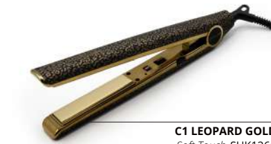
C1 LEOPARD GOLD Soft Touch SUK1266