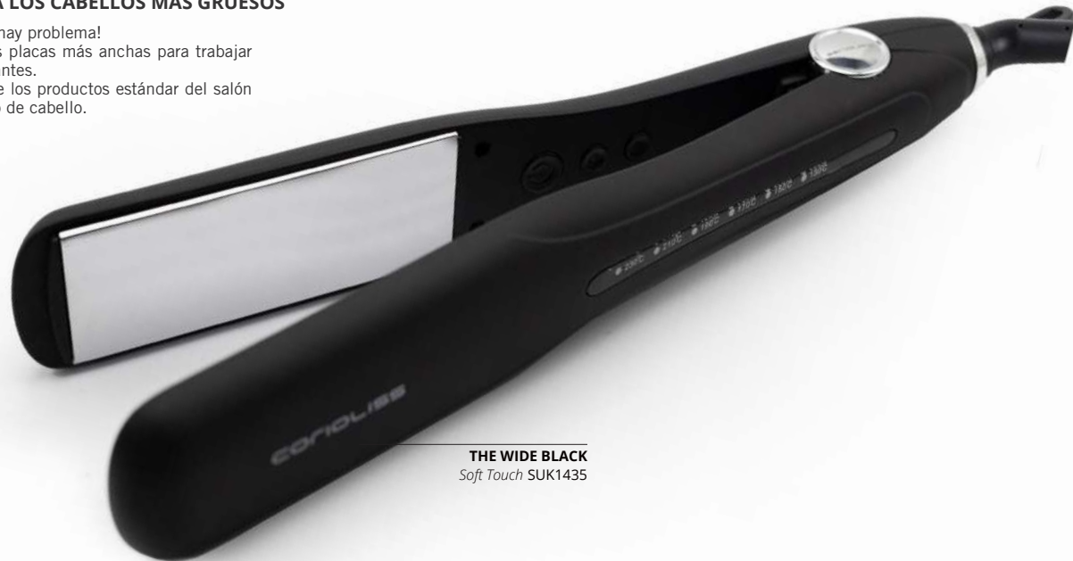
THE WIDE BLACK Soft Touch SUK1435

¿Melena gruesa o voluminosa? ¡No hay problema! Esta plancha está diseñada con las placas más anchas para trabajar fácilmente los cabellos más abundantes. Es una herramienta fantástica entre los productos estándar del salón porque permite alisar cualquier tipo de cabello.