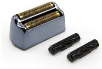
REPUESTO DE LÁMINA SUK1821

The Shaver es la nueva afeitadora Corioliss, potente y silenciosa con motor giratorio DC de alto rendimiento. Está diseñada para cumplir todas las expectativas en la rutina de afeitado profesional.