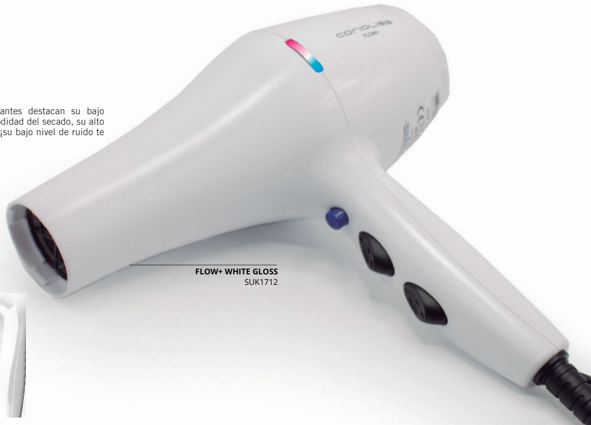
FLOW+ WHITE GLOSS SUK1712

Entre sus características más importantes destacan su bajo peso, que lo hace singular para la comodidad del secado, su alto caudal de aire y su velocidad. Además ¡su bajo nivel de ruido te encantará!