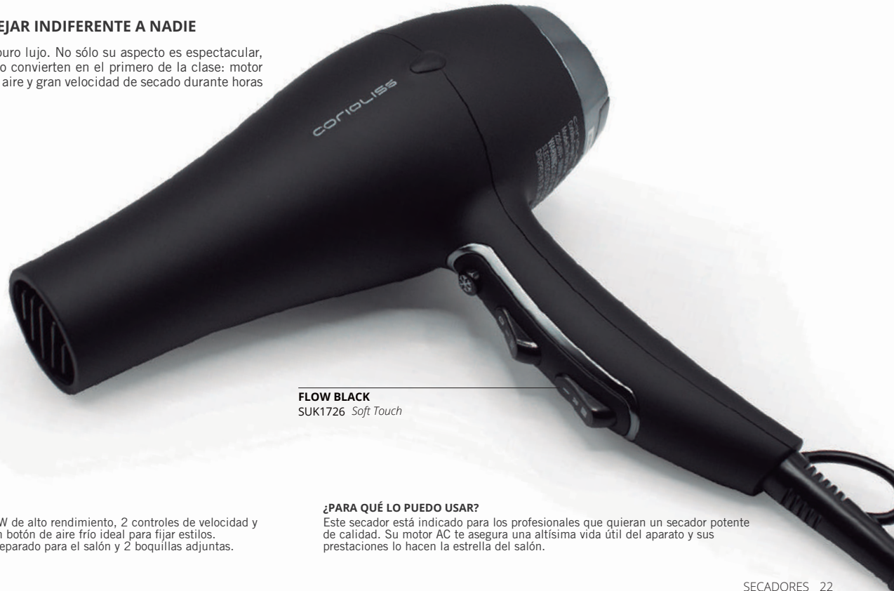
FLOW BLACK SUK1726 Soft Touch

Este secador profesional es puro lujo. No sólo su aspecto es espectacular, sus características técnicas lo convierten en el primero de la clase: motor súper potente, alto caudal de aire y gran velocidad de secado durante horas y horas de funcionamiento.