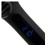
TRIPLE BARREL BLACK Soft Touch SUK1450

Está diseñada para crear volumen y textura... ¡acapara todas las miradas!