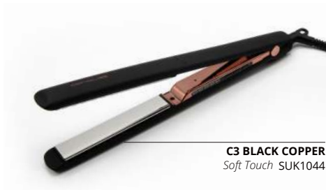
C3 BLACK COPPER Soft Touch SUK1044