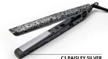
C1 PAISLEY SILVER Soft Touch SUK1265