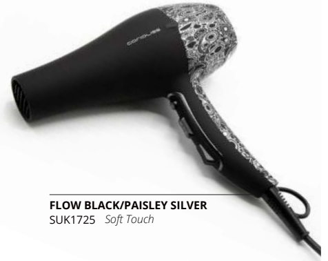
FLOW BLACK/PAISLEY SILVER SUK1725 Soft Touch