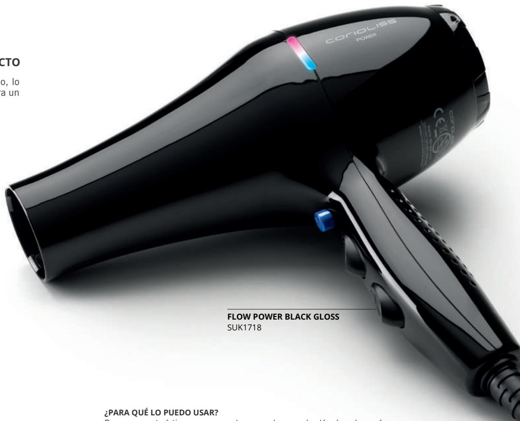
FLOW POWER BLACK GLOSS SUK1718

Es un secador de alta gama gracias a su motor de alto rendimiento que permite trabajar durante una larga vida útil. Tiene dos selectores de velocidad y dos de temperatura, así como un botón de aire frío. Su cable es de 2,8 metros preparado para el salón y contiene 2 boquillas adjuntas.