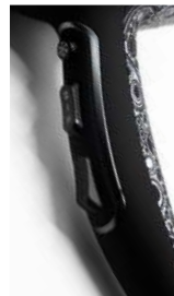
► Acabado metálico