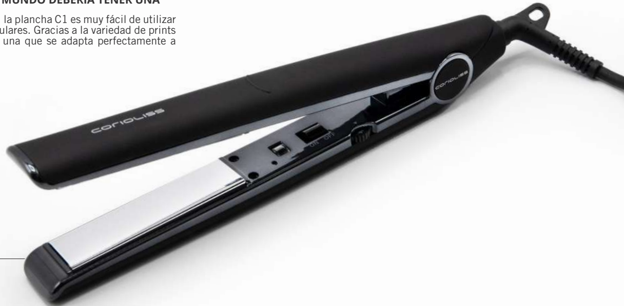
C1 BLACK CHROME SUK1261 Soft Touch

Con un diseño simple y eficiente, la plancha C1 es muy fácil de utilizar y logra unos resultados espectaculares. Gracias a la variedad de prints de este modelo seguro que hay una que se adapta perfectamente a tu personalidad.