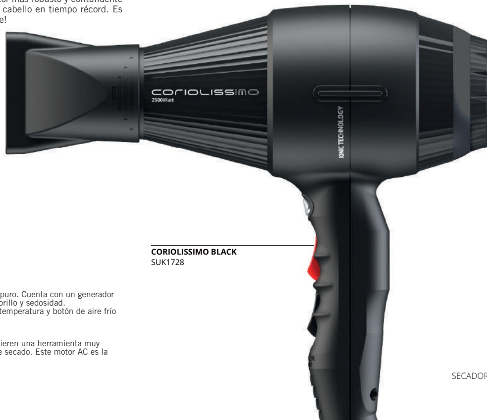
CORIOLISSIMO BLACK SUK1728

Es un secador indicado para los profesionales que quieren una herramienta muy potente de alto rendimiento que reduzca el tiempo de secado. Este motor AC es la estrella de los blowouts de peluquería.