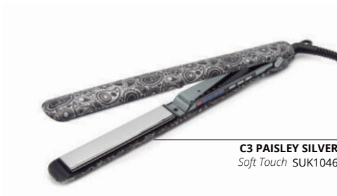
C3 PAISLEY SILVER Soft Touch SUK1046