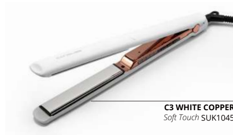
C3 WHITE COPPER Soft Touch SUK1045