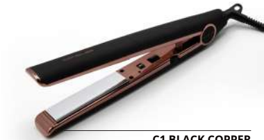
C1 BLACK COPPER Soft Touch SUK1263