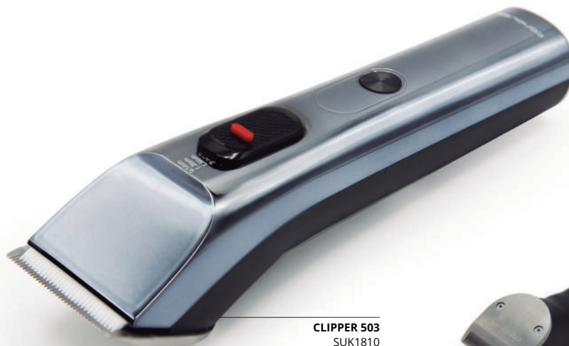
CLIPPER 503 SUK1810