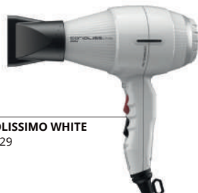
CORIOLISSIMO WHITE SUK1729

Este secador es potencia en estado puro. El motor más robusto y contundente de Corioliss proporciona 2500 W para secar el cabello en tiempo récord. Es un básico en el salón, si quieres fuerza ¡agárrate!