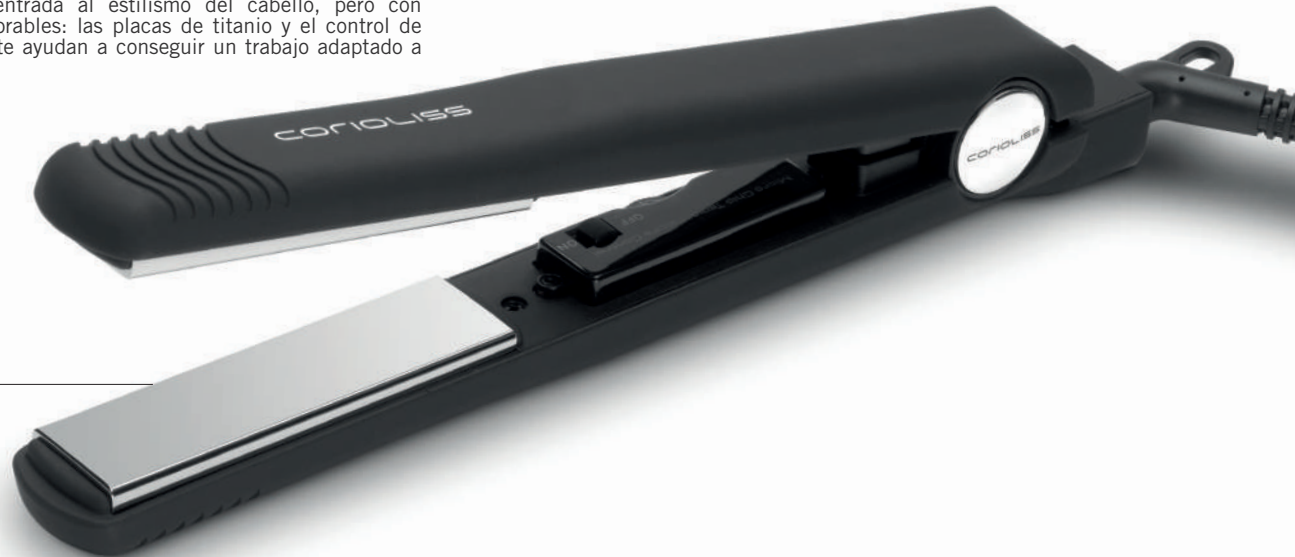
CSTYLE BLACK SUK1312 Soft Touch

Es nuestro nivel de entrada al estilismo del cabello, pero con unas cualidades inmejorables: las placas de titanio y el control de temperatura integrado te ayudan a conseguir un trabajo adaptado a tus necesidades.