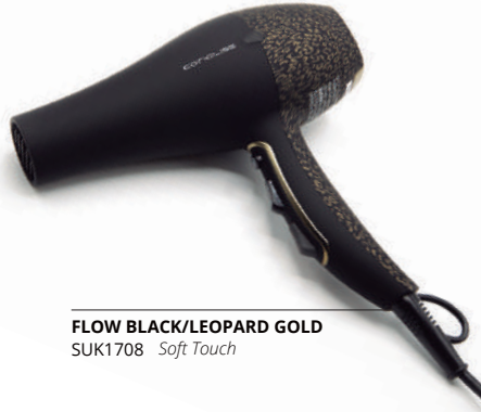
FLOW BLACK/LEOPARD GOLD SUK1708 Soft Touch