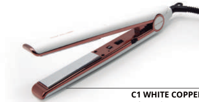
C1 WHITE COPPER Soft Touch SUK1264