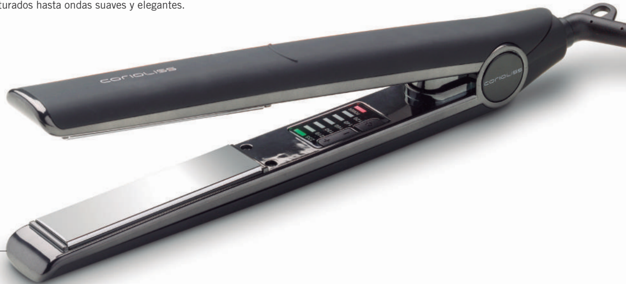
C1 DIGITAL BLACK SUK1280 Soft Touch

Su diseño simple y eficiente es muy fácil de usar con resultados sobresalientes. Esta plancha puede crear una gran variedad de estilos diferentes, desde lisos estructurados hasta ondas suaves y elegantes.