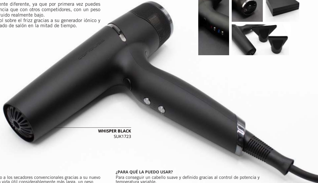
WHISPER BLACK SUK1723

Este nuevo secador es totalmente diferente, ya que por primera vez puedes disfrutar de 7 veces más potencia que con otros competidores, con un peso súper ligero y con un nivel de ruido realmente bajo. Ahora puedes tener total control sobre el frizz gracias a su generador iónico y además puedes lograr un acabado de salón en la mitad de tiempo.