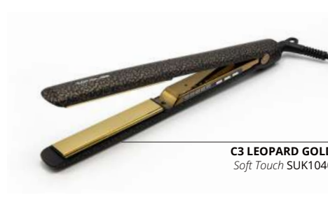
C3 LEOPARD GOLD Soft Touch SUK1040